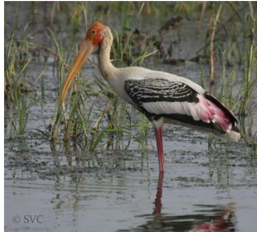
រនាសពណ៌

យើងអាចរីករាយគយគន់បក្សីប្រមាណជា៣៩ប្រភេទ រួមទាំងបក្សីទឹកដីស្រស់ស្អាត ដូចជាសត្វកសប្បត្រី រនាសពណ៌ និងត្រដេវីថា។