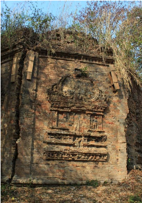
ប្រាសាទសម្បូរព្រៃគុហ៍ស្ថិតក្នុងខេត្តកំពង់ធំ គឺជាអតីតរាជធានីចក្រចេនឡាក្នុងសម័យបុរាណអង្គរ (សតវត្សទី៦ដល់ទី៩)។