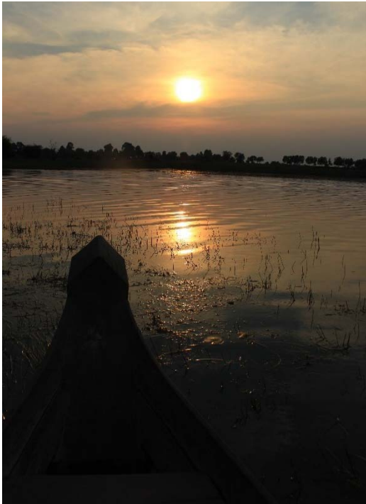
ទស្សនាថ្ងៃលិចជ័ស្រស់ស្រទន់ ដែលចាំងឆ្លុះនៅលើថ្ងៃទឹកបឹងអូរក្រញ៉ាកដ៏ស្រស់ស្អាត ហើយយើងក៏អាចស្តាប់សម្លេងបក្សាបក្សីជាច្រើនប្រភេទកំពុងរៀបចំឡើងទ្រនំនាពេលសាយ័ណ្ណ។

ចេញដំណើរពីទីរួមខេត្តកំពង់ធំ តាមផ្លូវជាតិលេខ៦៤ នៅភាគខាងជើង ចម្ងាយ១៦គីឡូម៉ែត្រ សំដៅទៅផ្លូវជាតិលេខ២១៩ រួចទៅភាគខាងកើតចម្ងាយ៥៧គីឡូម៉ែត្រ ឆ្ពោះទៅកាន់ទីរួមស្រុកសណ្តាន់ ក្នុងរយៈពេលប្រហែល២ម៉ោង។ ចេញពីស្រុកសណ្តាន់បន្តទៅភាគខាងកើតលើផ្លូវជាតិលេខ២១៩ ប្រហែល៣គីឡូម៉ែត្រ តាមផ្លូវដីធម្មតានៅភាគខាងត្បូងចម្ងាយ២គីឡូម៉ែត្រ ទៅដល់តំបន់ទេសចរណ៍បឹងក្រញ៉ាក។ នៅតាមដងផ្លូវនេះ អ្នកដំណើរអាចទស្សនាប្រាសាទបុរាណដែលបែកបាក់ឈ្មោះថា ប្រាសាទសម្បូរព្រៃគុហ៍ ដែលជាតំបន់បុរាណវិទ្យាមួយមានវ័យចំណាស់ជាងប្រាសាទអង្គរវត្តនៅក្នុងខេត្តសៀមរាប។ ពេលធ្វើដំណើរទៅស្រុកសណ្តាន់ យើងអាចឈប់សម្រាកបាន២ម៉ោងផងដែរ (ញ៉ាំអាហារនៅភោជនីយដ្ឋាន)។