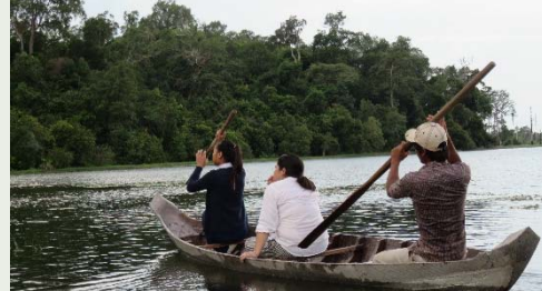
តំបន់សហគមន៍អេកូទេសចរណ៍អូរក្រចេះក្រចេះ ស្រស់ស្អាត និងព្រៃឈើនៅត្រើយខាងកើត។

យើងអាចជិះទូកត្នោត ឬទូកធ្វើពីដបទឹកស្អុយ លេងកំសាន្តលើបឹង ដើម្បីគយគន់ដងព្រៃព្រឹក្សាដ៏ខ្លៀវស្រងាត្តិ បក្សាបក្សី និងសកម្មភាព នេសាទត្រីបែបប្រពៃណី។